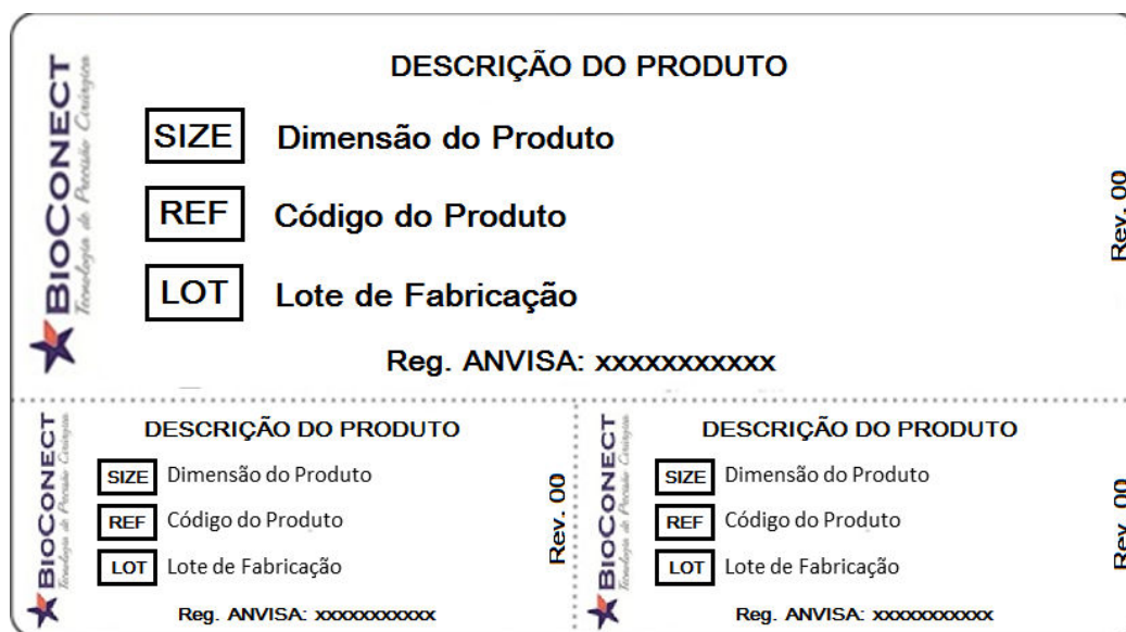
Modelo de Etiqueta de Rastreabilidade