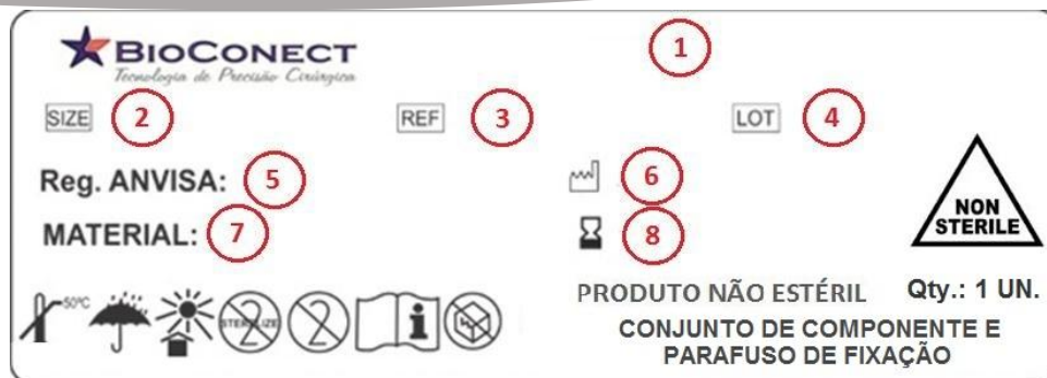
Modelo de Rótulo